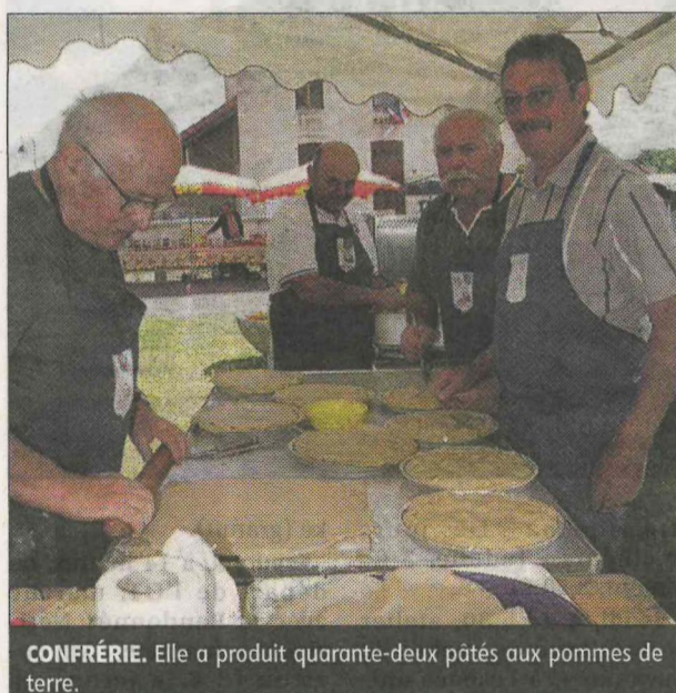
CONFRÉRIE. Elle a produit quarante-deux pâtés aux pommes de terre.

La recette, transmise avec passion, a reposé ce